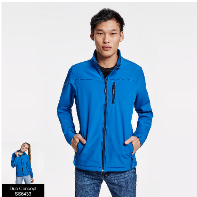
Duo Concept SS6433