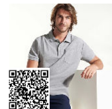
CENTAURO PREMIUM PO6607