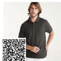
PEGASO PREMIUM PO6609