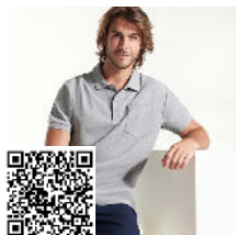
CENTAURO PREMIUM PO6607