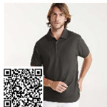
PEGASO PREMIUM PO6609