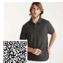
PEGASO PREMIUM PO6609