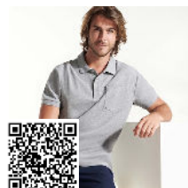
CENTAURO PREMIUM PO6607