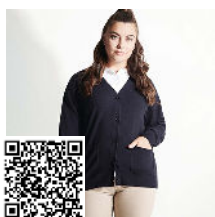
EXPLORER WOMAN CG8406