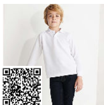
CARPE CHILD PO5008