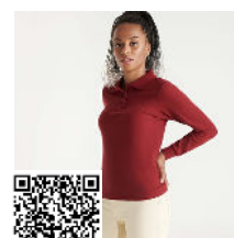
ESTRELLA WOMAN L/S PO6636