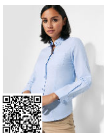
OXFORD WOMAN CM5068