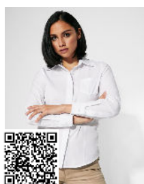
SOFIA L/S CM5161