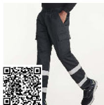
DAILY HV HV9307